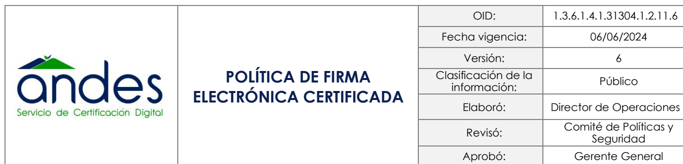
Tabla de contenido