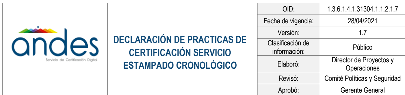
Tabla de contenido